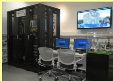
ビル制御システム1,2