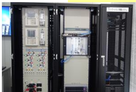
広域制御 (スマートシティ)