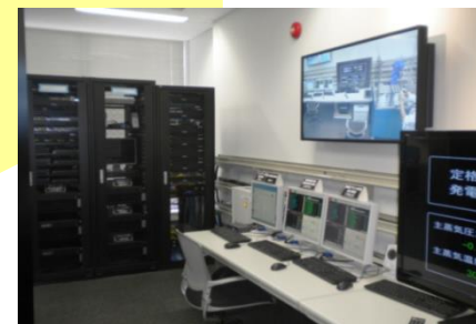
火力発電所訓練シミュレータ